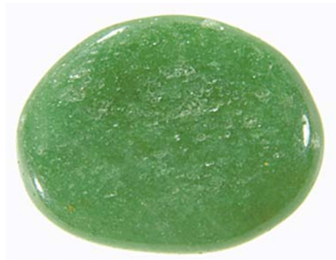
Grüner Aventurinquarz, ein fuchsihaltiges Quarzitgestein.

Was jedoch neu betrachtet, überprüft und ggf. neu bewertet werden muss, sind die Rückschlüsse und Interpretationen, die bei einzelnen Mineralien durch den Vergleich der empirisch ermittelten Heilwirkungen mit den inzwischen veralteten mineralogischen Daten gezogen wurden. Die Frage nach dem »Warum?« einer bestimmten Heilwirkung findet daher gemäß dem modernen Wissensstand neue Antworten. Und das Spannende daran ist: Vieles wird durch den aktuellen Kenntnisstand noch einleuchtender, verständlicher und logischer. Es passt einfach besser zur Wirkung des grünen Aventurinquarzes als Entspannungs- und Einschlafstein, dass es sich hier um ein metamorphes Ge-