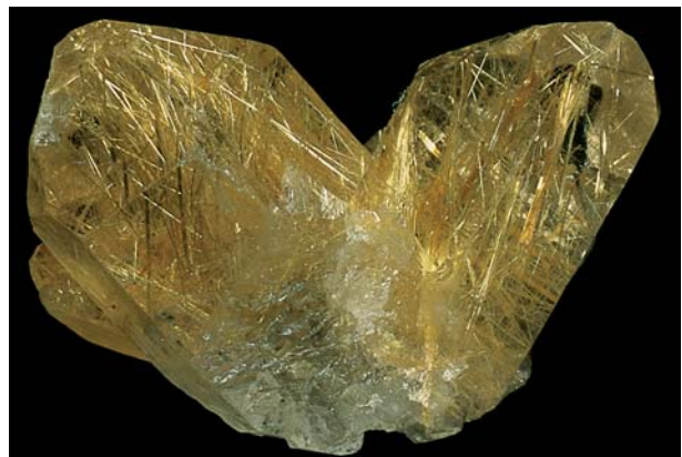
Rutilquarz: Einschlüsse von Rutil in Quarz

Hier wurden die früheren Angaben meist reduziert und in der Regel auf jene Elemente beschränkt, die tatsächlich ins Kristallgitter der jeweiligen Mineralien eingebaut werden. Als Einschlüsse oder Verunreinigungen vorhandene Elemente werden nur dann genannt, wenn sie für das Erscheinungsbild des Minerals verantwortlich sind (z.B. für die Farbe) oder tatsächlich als Einschluss ein bestimmtes Mineral (z.B. Rutilquarz, Turmalinquarz) bzw. eine Varietät (z.B. Dendriten-Chalcedon, Moosachat) definieren.