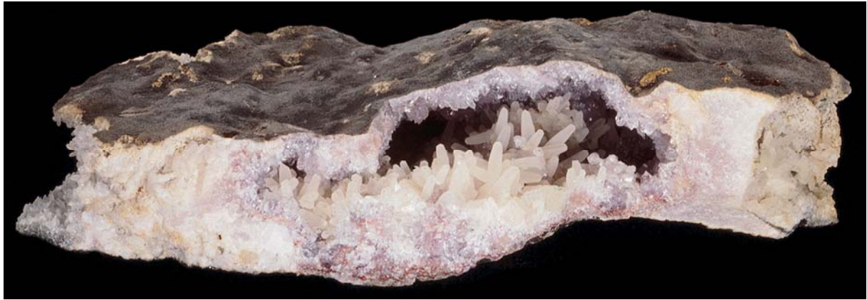
Hydrothermale Bildungen in Gängen und Gesteinshohlräumen können magmatischen, sedimentären oder metamorphen Ursprungs sein.

genauer definiert werden: Woher stammt die heiße Lösung, durch welchen Prozess ist sie entstanden? Michael Gienger unterscheidet aus diesem Grund in seinen Werken in »magmatisch-hydrothermal«, »sedimentär-hydrothermal« und »metamorph-hydrothermal«. Auch das stets in Übereinstimmung mit den modernsten wissenschaftlichen Forschungsergebnissen.