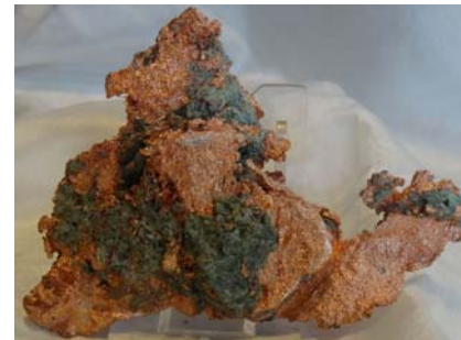
Gediegen Kupfer, Michigan/USA