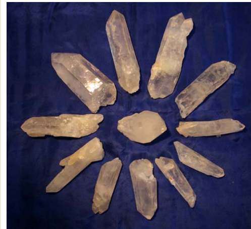
Bergkristall, Selbst- heiler (Harmonie- quarze), Brasilien 5 x € 19,80 ca. 40-60g, ca. 8-10 cm 4 x € 24,80 ca. 90-125g, ca. 6-11 cm 2 x € 32,80 157+218g, 12+10 cm