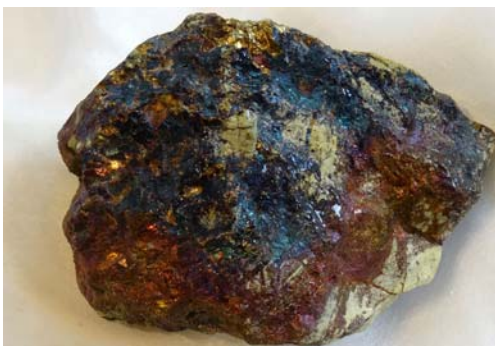
Chalkopyrit in Quarz, Alban/Frankreich mit natürlichen (!) Anlauffarben