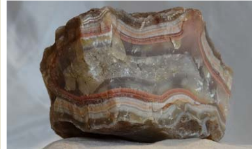
Achat, Hunsrück, Deutschland