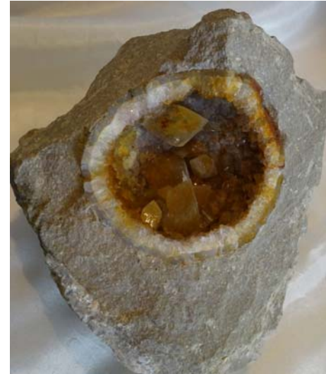
Calcit-Druse, Hunsrück, Deutschland