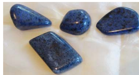
Dumortierit, Mozambique (Trommelsteine)