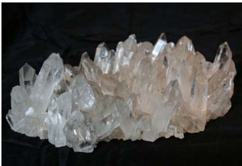
Bergkristall, sehr große Gruppe, Arkansas/USA € 1.160,00 3128g, 28 x 9 x 20 cm (Gruppe mit vielen versch. Kristallformen!)