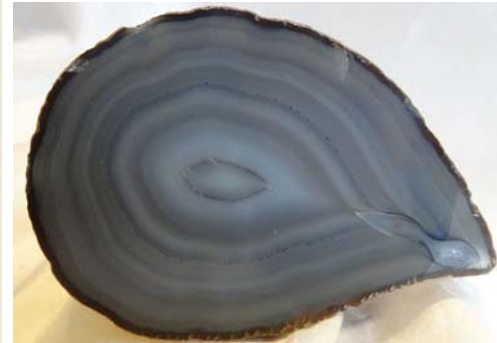
Achat, Brasilien (Ventilachat)