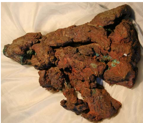
Gediegen Kupfer mit Cuprit-Überzug, Michigan/USA