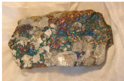
Chalkopyrit in Quarz, Alban/Frankreich mit natürlichen (!) Anlauffarben