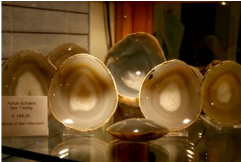
Achat-Schalen Set 7-teilig

Der Erlös dieser Steine kommt zu 100% dem »Neuen Lexikon der Heilsteine« zugute.