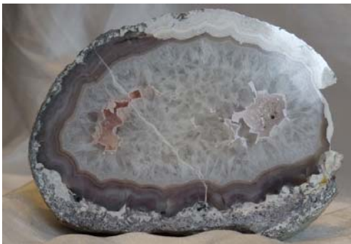
Achat, Hunsrück, Deutschland