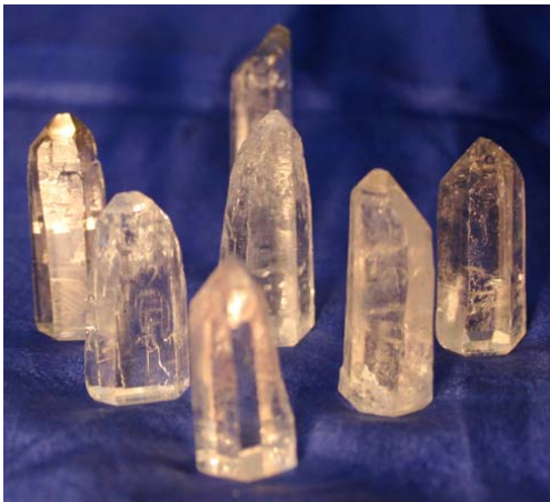
Bergkristall, kleine Kristalle stehend (polierte Basis) € 12,80 ca. 10 – 12 g, ca. 3 cm (noch 2 Stück)