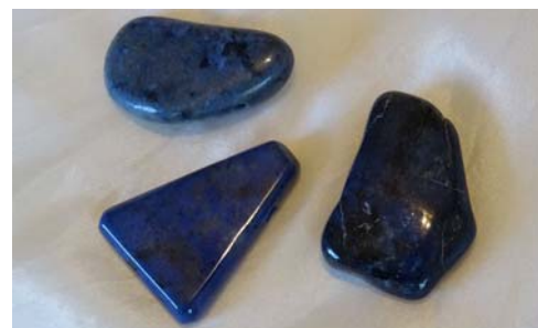
Dumortierit, Mozambique (TS gebohrt)