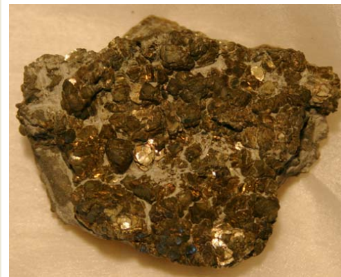
Chalkopyrit, Hunan/China mit kleinen blättrigen Kristallen