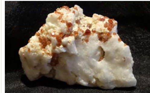
Granat Spessartin auf Orthoklas, China