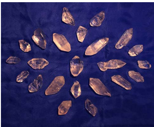
Bergkristall, kleine Doppelender € 9,80 ca. 5 – 15 g, ca. 2,5 – 3,5 cm