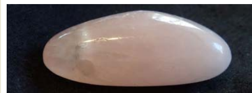
Morganit, Brasilien (gebohrt)