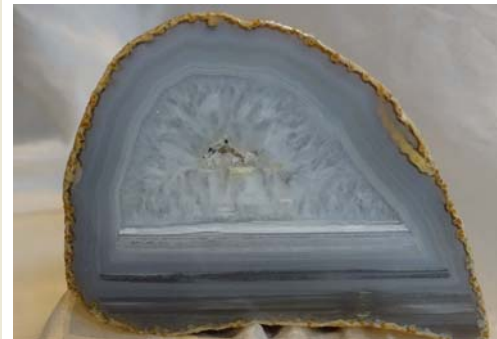
Achat, Brasilien (Kristallachat + Uruguayachat)