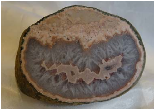
Achat, Hunsrück, Deutschland