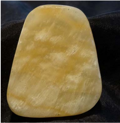
Calcit-Scheibe, Algarve, Portugal