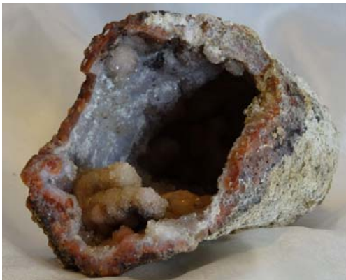
Chalcedon in Druse, Brasilien