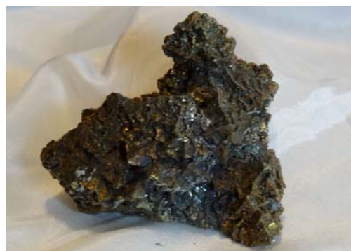
Chalkopyrit, Hunan/China (Skelettwachstum)