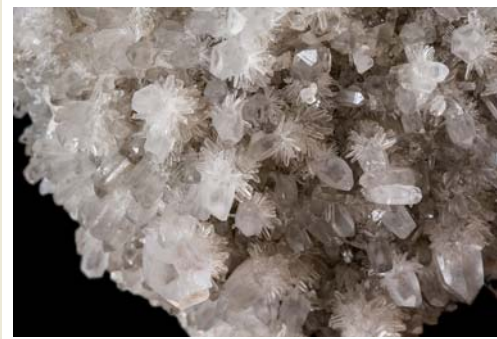
Große Bergkristall- gruppe, Nadelquarze + Sonnenquarze, Brasilien (Rarität!) € 498,00 1944g, 19 x 9 x 13 cm (Ausschnittsfoto)