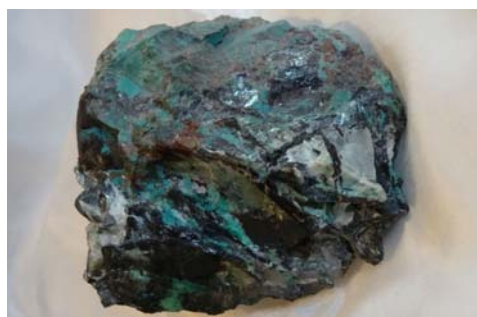
Chrysokoll mit Hämatit, Mexiko