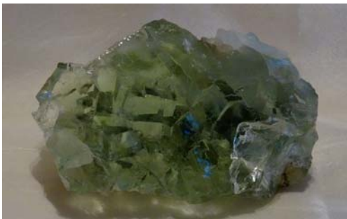
Fluorit, China (schöne, sehr klare Kristallstufe)