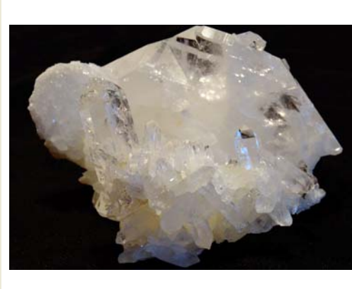
Bergkristall, Pakistan (Fadenquarz) € 56,80 163g, 7 x 7 x 5 cm