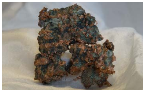
Gediegen Kupfer, Michigan/USA