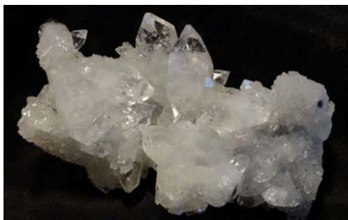
Apophyllit auf Chalcedon